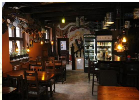
Sala na parterze

Serdecznie zapraszamy do skorzystania z oferty. Wierzymy, że atmosfera którą tworzymy pozostawi niezapomniane wrażenia u wszystkich naszych gości.